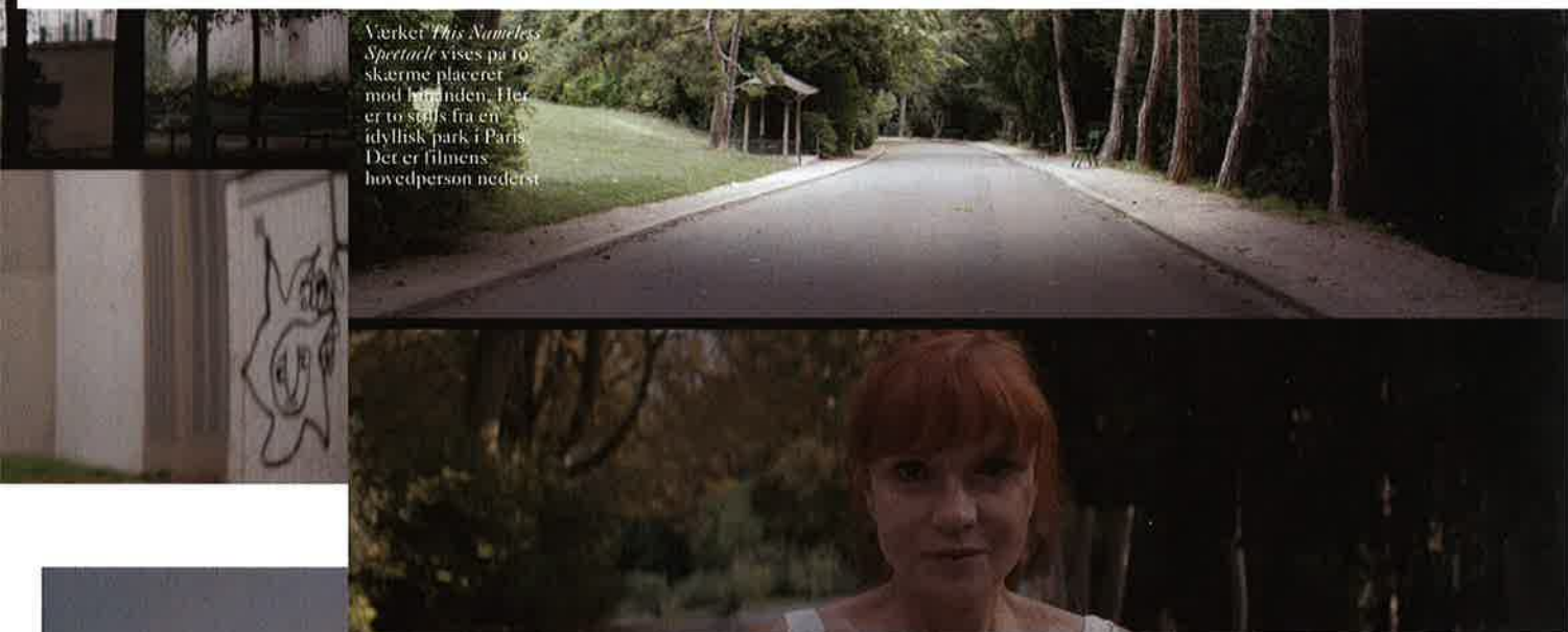
Værket This Nameless Spectacle vises på to skærme placeret mod hinanden. Her er to stills fra en idyllisk park i Paris. Det er filmens hovedperson nederst

Se mere på Jesperjust.com og Nicolai@allner.com